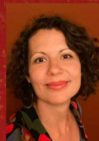
Shakti Katrin Tantra-Lehrerin (KTI) III. Grad